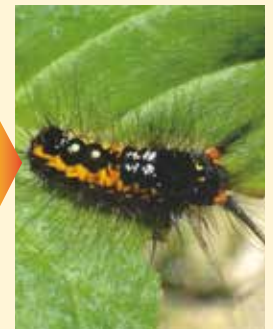
処理3日後 (日本農薬(株)総合研究所)