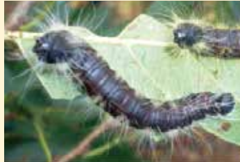
モンクロシャチホコ