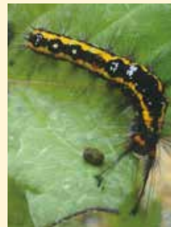
ロックオン1,000倍処理前